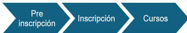
Ilustración 2. Metodología presentada comité 17/febrero/2025

La formación abarca diversas sesiones temáticas especializadas en acabados arquitectónicos, brindando a los participantes conocimientos técnicos y prácticos que fortalezcan sus habilidades.