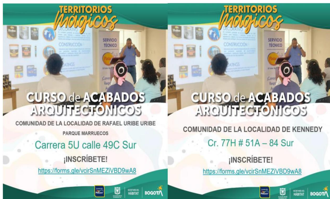
Ilustración 4. Pieza de convocatoria inscripción cursos de formación

Desde la Fundación Pintuco, hemos venido desarrollando el proceso de socialización de los Cursos de Acabados Arquitectónicos en los 12 Territorios Mágicos donde estamos activos. Durante esta fase, hemos identificado un alto interés por parte de la comunidad, generando expectativas positivas respecto al número de personas que podrían beneficiarse de esta formación.